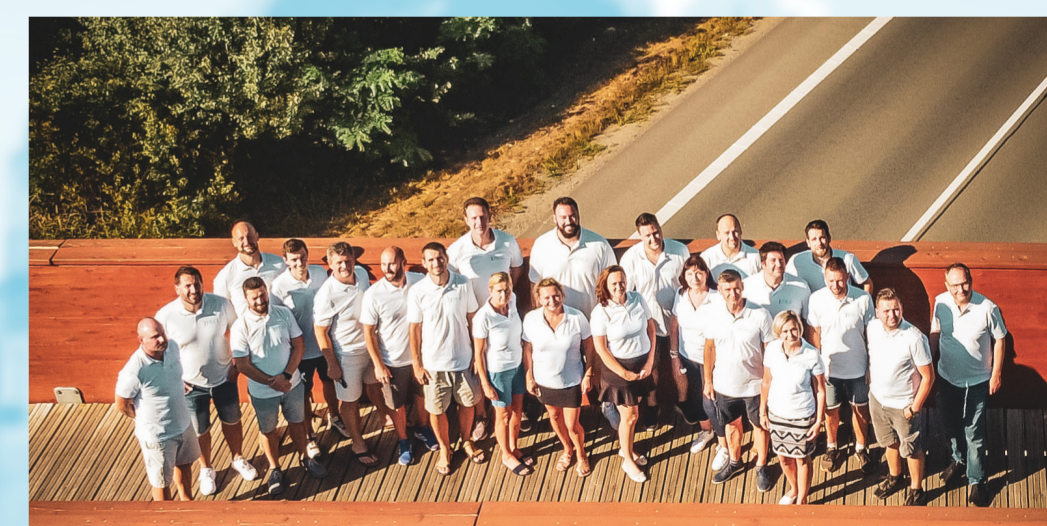
Jsmo připraveni pracovat PRO Hodonín.

Pokud jste ještě nečetli naše 1. číslo novin, najdete jej na našich webových stránkách www.hnutiprohodonin.cz