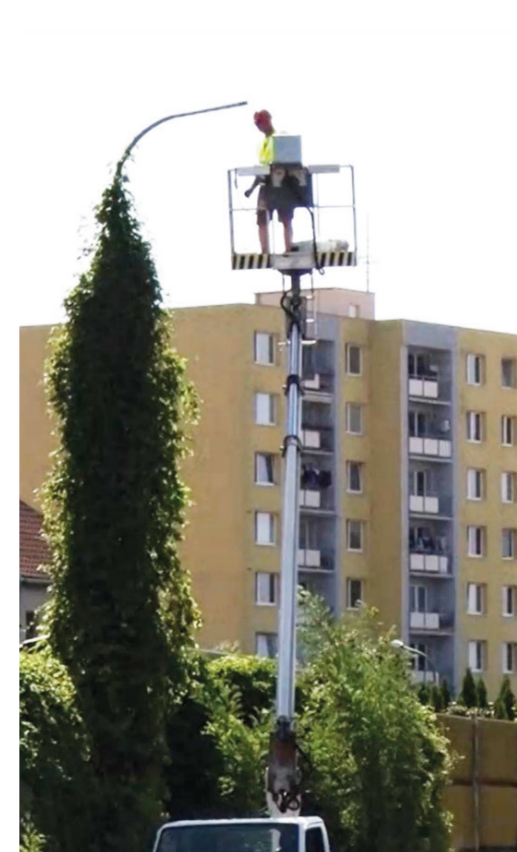
Výměna starého osvětlení za LED světla na ulici Anenské.

Již nyní prochází modernizací veřejné osvětlení. Bylo vyměněno 320ks starých sodíkových lamp za moderní LED světla s autonomním režimem stmívání. Nově jsou vybudovány první dvě solární lampy na Mrkotálkách a další jsou v plánu u lávky u zoo. Bohužel, nepříznivá situace na trhu s energiemi nutí města zamýšlet se více i nad jinými úsporami. Již nyní počítáme s postupnou instalací fotovoltaických elektráren na většinu budov v obecním majetku. V příštím roce by měla být instalována první z nich na budovu městského úřadu. Budovy základních, mateřských škol, zimní stadion, sportovní hala, hotel Krystal, lázně, knihovna či budova ZUŠ, to je jenom část ze seznamu celkem 30 městských budov, které jsou vytipovány pro instalaci FVE. Také u nově plánovaných projektů již myslíme, při samotném zadání, na využití solární energie, zasakovacích ploch či retenčních nádrží, které přispějí k modrozelené infrastruktuře.